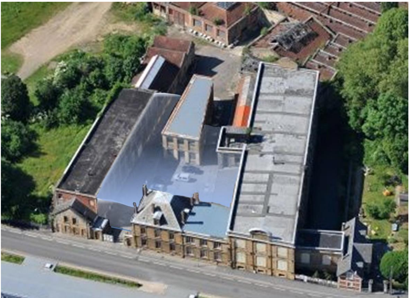
Ici la verrière sur le trapèze n'est pas représentée